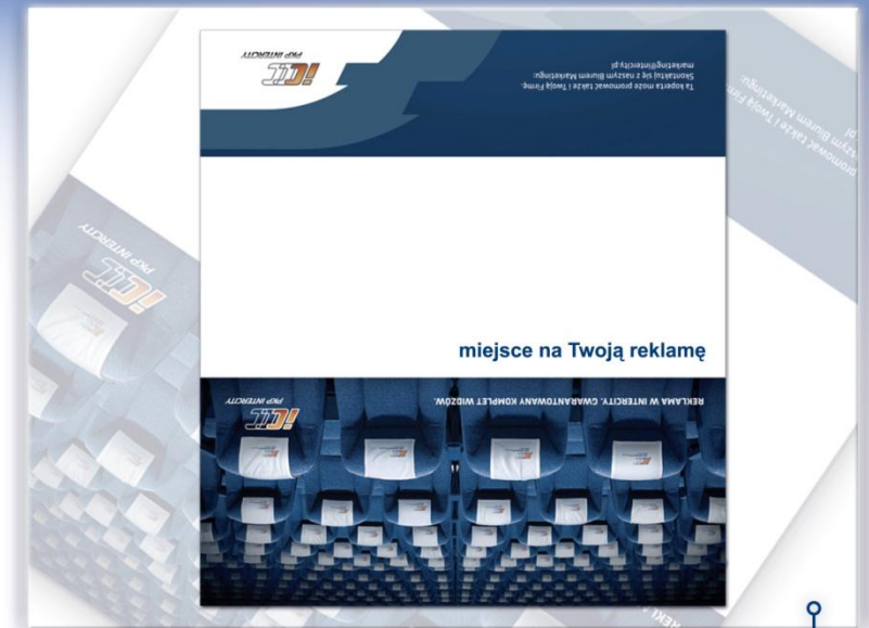
Reklama na tylnej stronie koperty