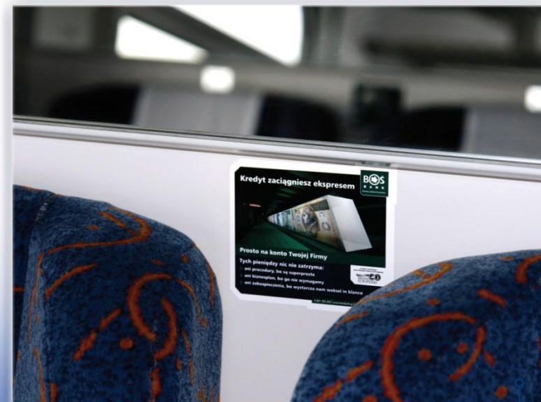
Nad zagłówkiem – wagon przedziałowy