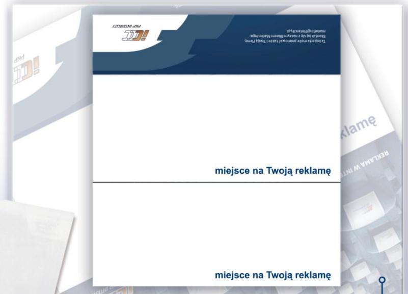
Możliwość reklamy również na całej powierzchni