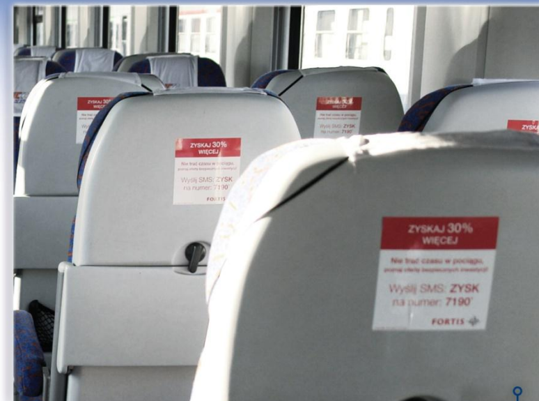
Tył zagłówka – wagon open space